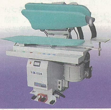
サンドイッチプレスYZK-123A

「腰まわりが修正しやすい」は、前機種からの変更点として、▽フロップファンを高効率モーターを採用。▽蒸気吹き出し量アップで生産性アップに貢献。▽アタリ、テカリ防止に自緩機を搭載。▽コテの形状を変更することで、腰まわりの仕上げが可能に。▽上コテの重さをゼロにすることで弱圧プレスができる。▽フロップも移動可能。▽フックとマジックテープでカバー交換が簡単。万能タイプのコテ台として「手直しが楽」としている。もちろん、従来タイプのコテを持つ「YZK-124A」(プレス専用タイプ)もラインナップしている。