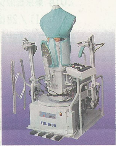
人体フィニッシャーYJK-016A/B

高品質で好評の人体フィニッシャーが省スペースになってリニューアルされた。人体フィニッシャー「YJK-016A/B」の大きな特長は、袖広げアームを取り付けられ、袖からジャケットまで幅広く仕上げが可能。高効率モーターを採用し、コンパクトにもなる。蒸気噴射口を