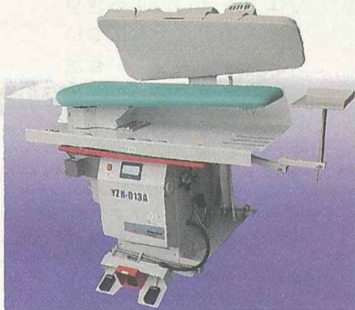
スポン万能プレスYZK-013A

アタリ防止機構を搭載して、▽アタリ、テカリの防止として自緩機機構を搭載。プログラムでもアタリ防止プログラムを搭載した。▽作業環境を良くするために、スチームをバキュームする機能を追加。▽風量アップにより吹き上げ時に仕上